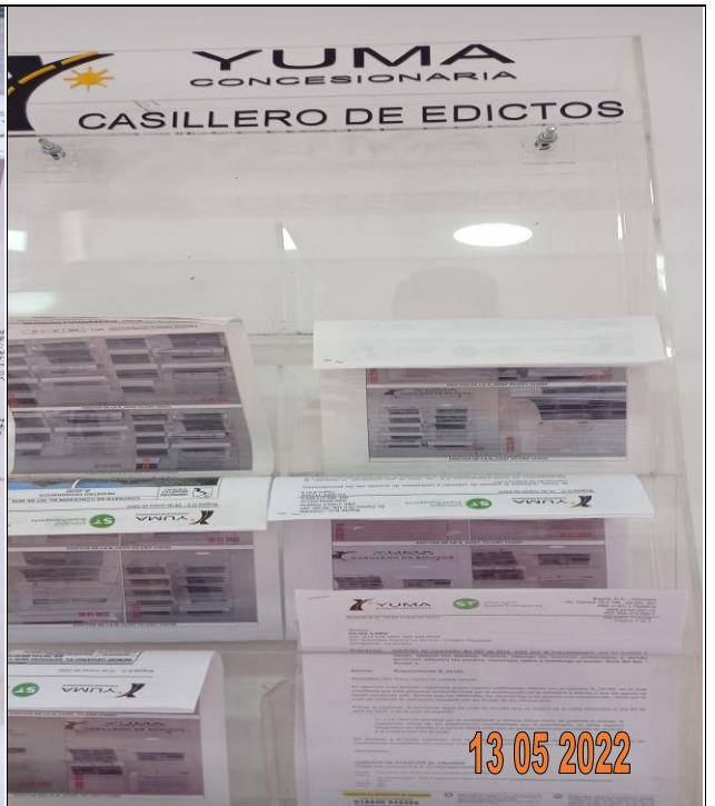
EDICTOS DE LA R_34188 YC-CRT-114170