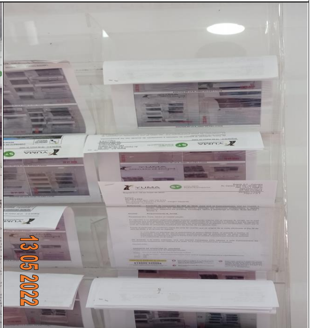
EDICTOS DE LA R_34188 YC-CRT-114170